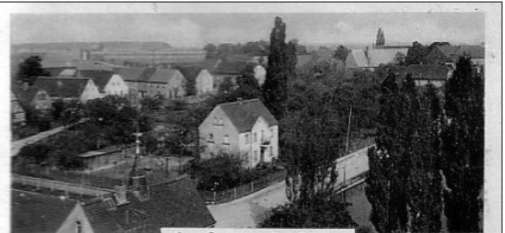
Gruß aus Großbuch