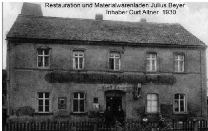
Restauration und Materialwarenladen Julius Beyer Inhaber Curt Altner 1930