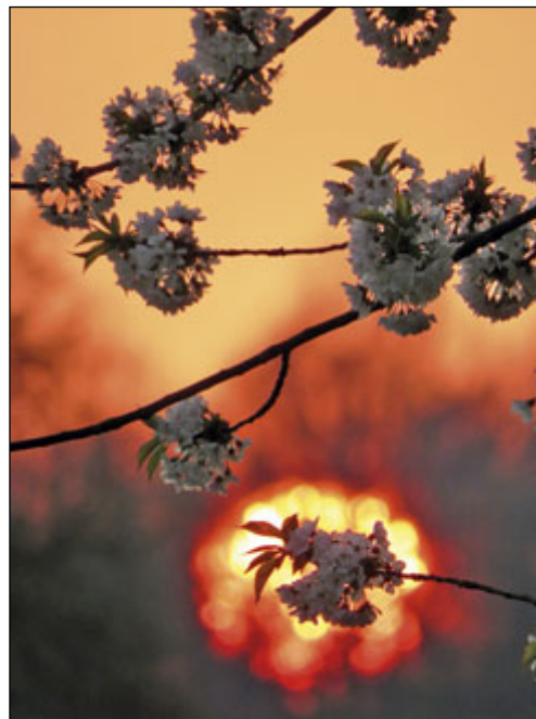
Kirschblüten in der Abendsonne bei Großbuch