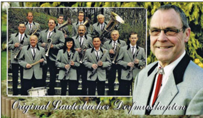
die Original Lauterbacher Dorfmusikanten

Unsere Gäste erwartet ein abwechslungsreiches Kinderprogramm mit Action auf dem Bangee-Trampolin, Hüpfburg, Spaß mit Clown Tilo und Tina mit Luftballonmodellage und Kinderschminken und viele lustige Kinderspiele. Auch wundersame Gestalten werden uns begegnen. Ab 15.30 Uhr erleben wir die neuesten Tanzdarbietungen der Sunny-Girls aus Otterwisch.