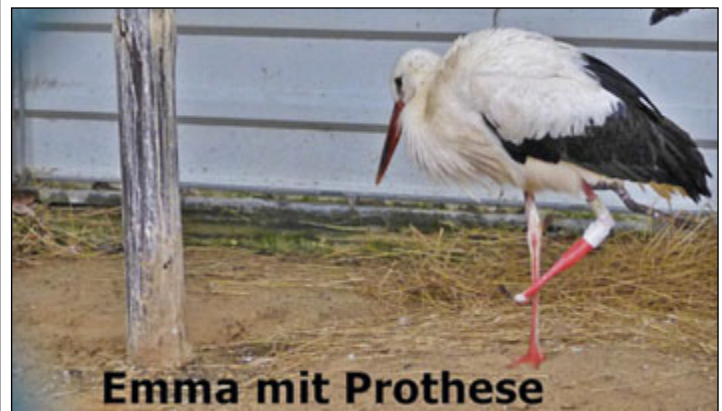
Emma mit Prothese

Unser Pechvogel "Emma" vom letzten Jahr lebt immer noch auf dem Storchenhof in Loburg mit einer Prothese. Es wird noch nach einer Stelle gesucht, wo sie in Zukunft bleiben kann.