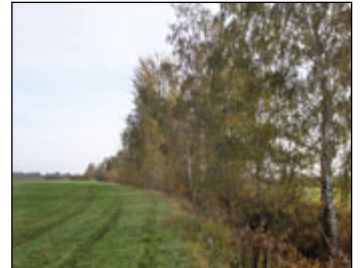
Blick von der Hauptstraße

Das kleine Gewässer kam aus dem Breiten Holz in Steinbach. Die dem Kammergut Lauterbach fronpflichtigen Bauern mussten einen mehrere Meter hohen Damm aufschütten. Den sandigen Lehm gruben sie aus dem Hang etwas unterhalb. Auf die Sohle wurde ein mächtiger ausgehackter Eichenstamm als Siel gelegt und mit starken Pfosten abgedeckt. Der Teich brachte einen