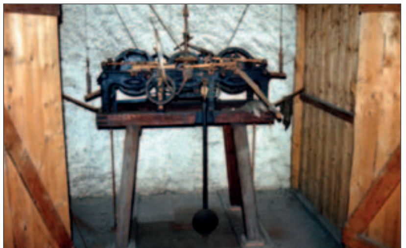
Das Uhrwerk von 1896