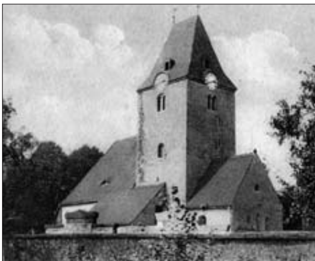
Der Kirchturm 1940