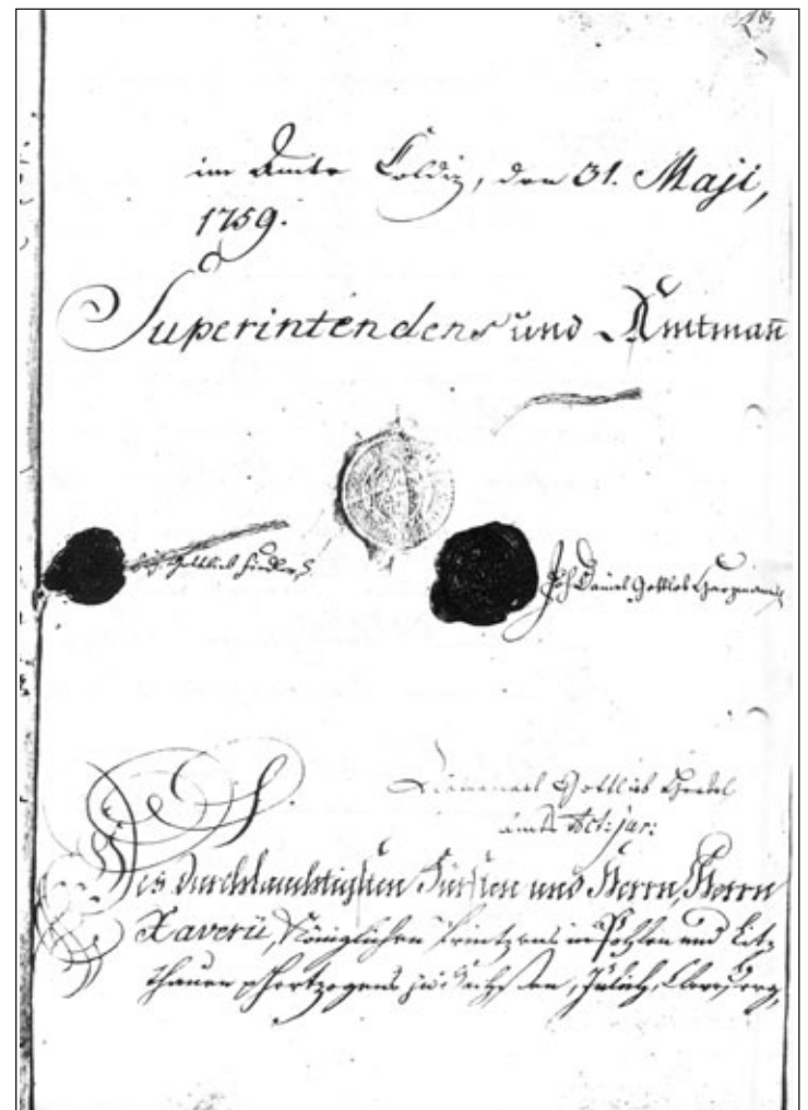
Vertrag von 1759